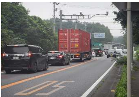
渋滞状況（国道254号）本田小川線関連

そこで、産業団地の造成が予定されている箇所などについて、アクセス道路の整備を重点的に行い、円滑な交通を確保し、周辺での渋滞緩和や地域の振興を図る。