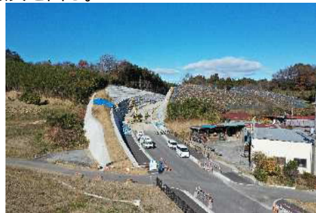
整備状況（本田小川線）