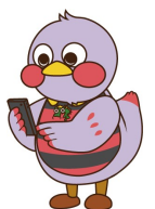
埼玉県のマスコット 「さいたまっちゃん」