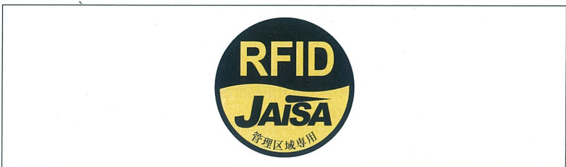
図3 管理区域専用RFID機器用ステッカ

注1：ここでは、公共施設や商業区域などの一般環境下で使用されるRFID機器を対象としており、工場内など一般人が入ることができない管理区域でのみ使用されるRFID機器（管理区域専用RFID機器）については対象外としている。なお、管理区域専用RFID機器については、（一社）日本自動認識システム協会において、一般環境への流出を防止するため、取扱説明書等に注意書きを記載するとともに、管理区域専用RFID機器用ステッカ（図3）を貼付することとされている。