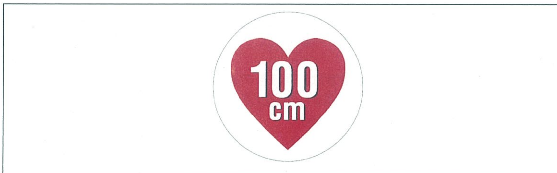
図2 据置きタイプRFID機器（高出力型950MHz帯パッシブタグシステム）用ステッカ

注1：ここでは、公共施設や商業区域などの一般環境下で使用されるRFID機器を対象としており、工場内など一般人が入ることができない管理区域でのみ使用されるRFID機器（管理区域専用RFID機器）については対象外としている。なお、管理区域専用RFID機器については、（一社）日本自動認識システム協会において、一般環境への流出を防止するため、取扱説明書等に注意書きを記載するとともに、管理区域専用RFID機器用ステッカ（図3）を貼付することとされている。