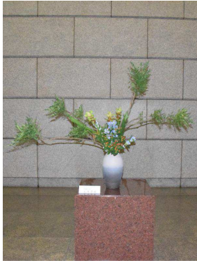
ルクマ草、りんどう(絞り)、ヒペリカム