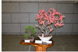
【展示】放春花(ボケ)、錦松