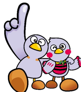
埼玉県マスコット 「コバトン」「さいたまっち」