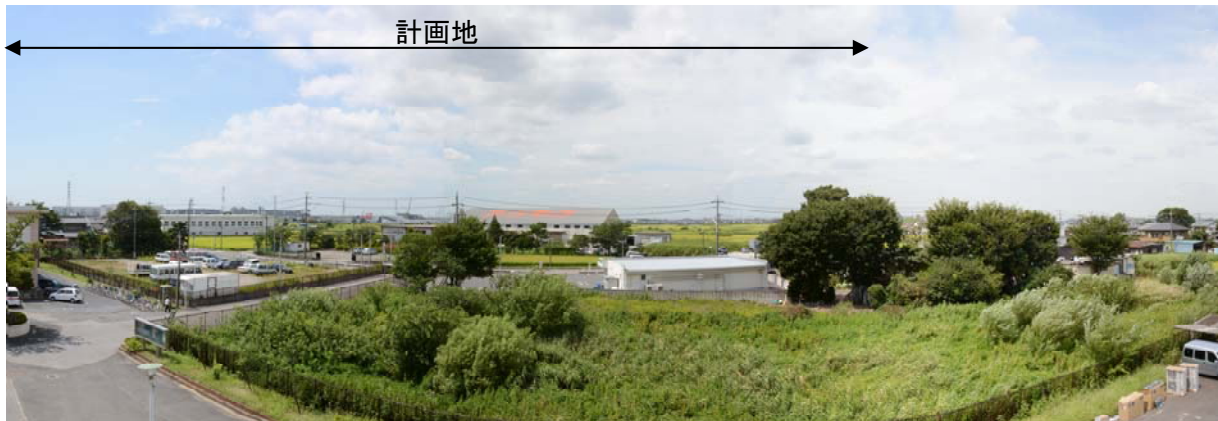
8 月 (夏季)