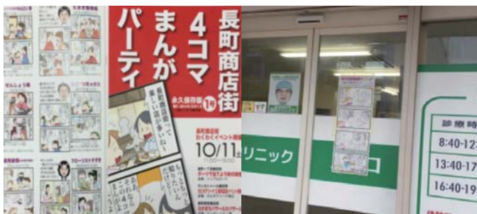
4コマ漫画による紹介冊子(左上)、店頭に掲示している(右上)

長町商店街周辺は、新興マンションが続々と立地し、30～40歳代の新住民世帯が急増している。この新住民を新たな顧客として商店街に取り込むため、親しみやすい「漫画」をツールとした情報発信をすることになった。