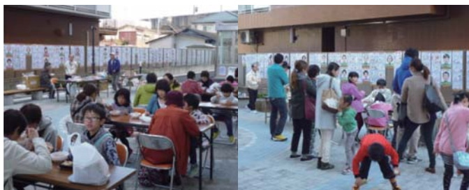
記念イベントの様子