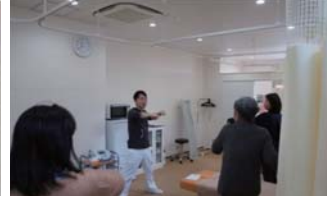
頭痛を改善させる習慣を教える講座(接骨院)