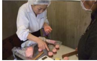
和菓子の手作り体験講座(和菓子店)