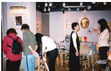
燦ぎやらりー内でのイベントの様子