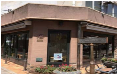
燦ぎやらりー外観

商店街事務所の移転に伴い、事務所として使用していたスペースに空きが生じ、その後の使用方法を検討することとなった。商店街の顧客(主に女性)のニーズも踏まえながら、商店街で議論したところ、市民の情報発信の場、交流の場となる「多目的ホール」の意見が多かったため、ギャラリー運営を始めた。