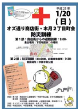
防災訓練のチラシ