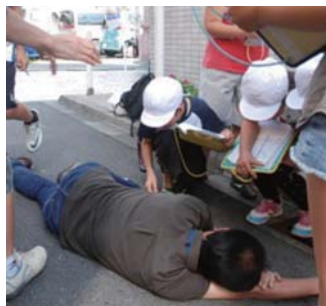
商店街での防災訓練の様子

東日本大震災をきっかけに、商店街の災害対応力を強化し、地域の安全・安心に貢献していきたいと考えたから。