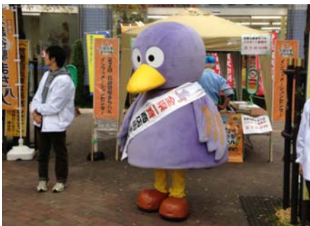
着ぐるみの中も大学生です