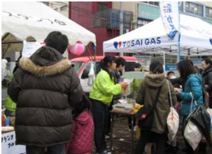
インフォメーションセンターの様子

近年、北越谷商店会では、会員の高齢化などによりイベント時の人手不足が顕著となっていた。このため、商店街にあるラーメン屋の常連客の大学生に、店主が街バルの運営の手伝いをしてもらえないか声掛けをしたところ、参加してもらえることになった。