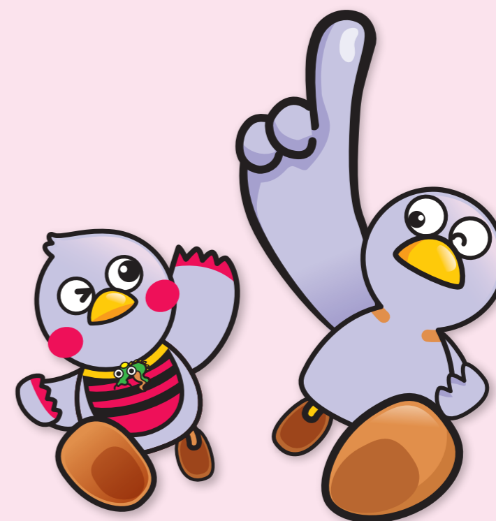
埼玉県マスコット「コバトン」 「さいたまっち」