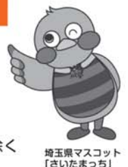
埼玉県マスコット「さいたまっちゃん」

受付時間 9:00~16:00(月~金) 祝日・12月29日~1月3日を除く 川口は土曜日でも受付します。